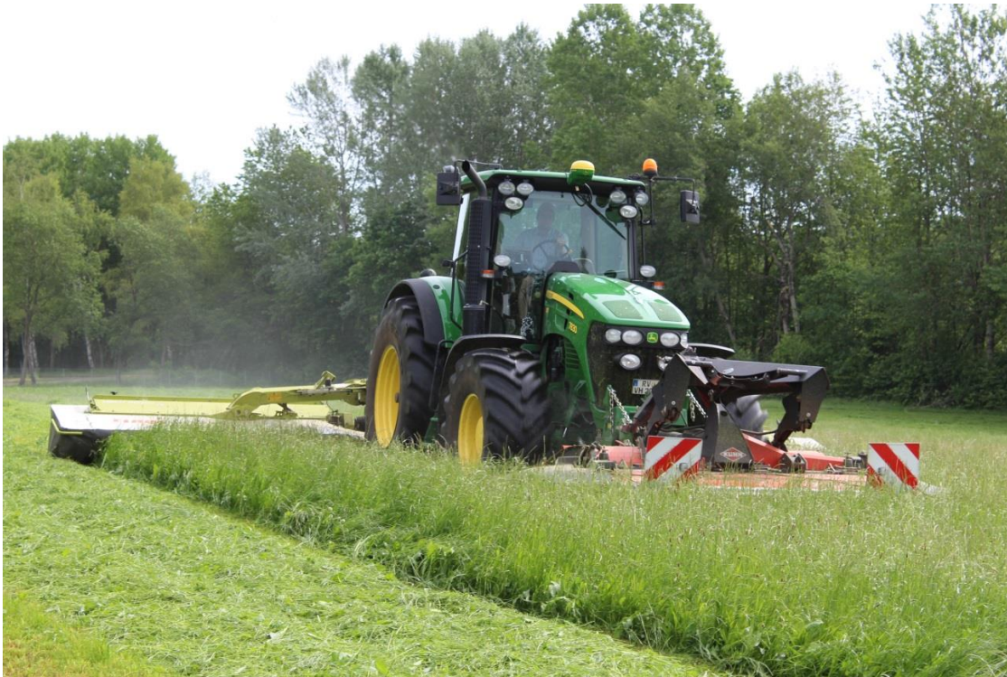
Abbildung 1: Schmetterlings-Mähkombination im Einsatz (ein Front- und zwei Heckmähwerke).

Mähverluste spielen bei Wildtieren eine große Rolle. Für das Jungwild wie Feldhasen, Rehkitze und Bodenbrüter gab es in der Evolution eine gute Überlebensstrategie: Bei Annäherung einer Gefahr reglos am Boden liegend zu verharren und sich auf die Tarnfärbung zu verlassen anstatt zu fliehen. Bei der heutigen Grünlandbewirtschaftung mit walzen, häufigen Schnitten, schnellen Maschinen und großen Arbeitsbreiten ein fataler Fehler.