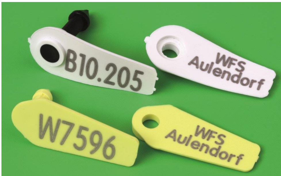
Abbildung 3: Oben: neue Marke (Supertag Size 1), unten: alte Marke (Jumbo Rototag)

Bei der Rehwildmarkierung gibt es dieses Jahr Veränderungen. Da die bisher verwendete Marke nicht mehr hergestellt wird, verwenden wir nun einen neuen Markentyp. Wenn Sie noch mit der alten Jumbo-Ohrmarke markieren wollen (siehe Abbildung 3), können wir Ihnen für die nächsten Jahre noch Restbestände anbieten. Bitte geben Sie bei der Bestellung der Marken an, welchen Markentyp sie wünschen.