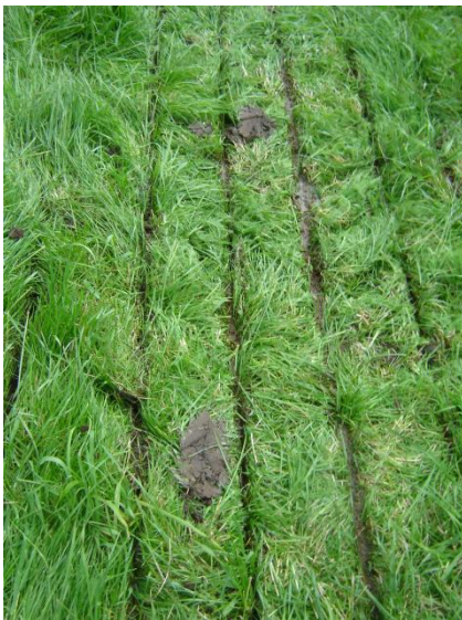
Bild 2: Bei zu feuchten Bedingungen kann die an den Scheiben anhaftende Erde zu Narbenschäden und Futtermittelschmutzungen führen. Deshalb sollte der Boden bei der Ausbringung mit dem Schlitzgerät gut abgetrocknet sein.